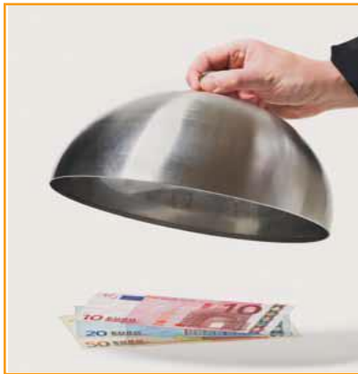
Professionelles Forderungsmanagement fördert den Cashflow.

Insbesondere in kleinen und mittelständischen Unternehmen kann es oft zu langen Zahlungsverzögerungen und hohen Forderungsausfällen kommen. Mit einem professionellen Kredit- u. Forderungsmanagement verbessern Sie Ihre Liquidität.